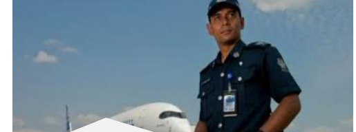
6. Vigilancia y principios de actuación