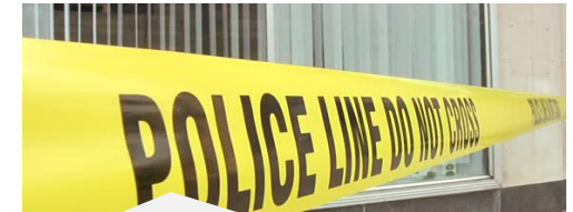
8. Procedimientos emergencia