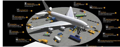
2. Medidas de protección generales