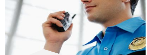
7. Notificación de incidencias