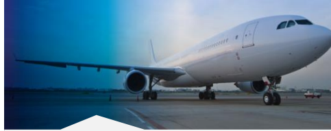
1. La protección de aeronaves